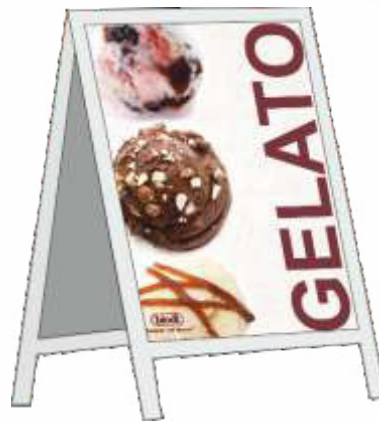
Straßenaufsteller mit Plakat · zum kleinen Preis ·