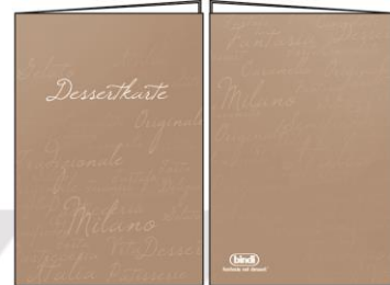
Nr. 3 Beige

Teilen Sie uns die ausgewählten bindi Produkte (3- 20 Artikel) mit und senden Sie uns, wenn gewünscht, Ihr Logo sowie Ihre Kontaktdaten incl. Bezugsquelle der Produkte per E-Mail an marketing@bindi.de .